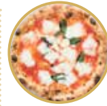
Margherita con mozzarella di bufala 水牛のモッツアレラチーズのマルゲリータ ¥ 2,600-

トマトソース、モッツアレラチーズ、ロースハム、リコッタチーズ、バジル、EXVオリーブオイル Tomato sauce, mozzarella cheese, ham, ricotta cheese, basil, extra virgin olive oil