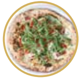
Amedeo アメデオ ¥ 2,600-

水牛のモッツアレラチーズ、ミニトマト、バジル、EXVオリーブオイル Buffalo mozzarella cheese, cherry tomatoes, basil, extra virgin olive oil