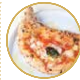
Ripieno リピエノ ※具を包み込んだピッツァです! ¥ 2,700-

モッツアレラチーズ、リコッタチーズ、サラミ、チコリ(豚バラ肉のコンフィ)、ロースハム、黒胡椒、バジル Mozzarella cheese, ricotta cheese, salami, fried pork, ham, black pepper, basil