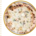
Quattro Formaggi 4種類のチーズ ¥ 2,600-

モッツアレラチーズ、生ハム、ルーコラ、バジル、EXVオリーブオイル Mozzarella cheese, dry cured ham, rocket salad, basil, extra virgin olive oil