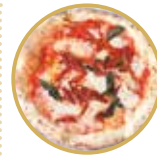
Diavola ディアヴォラ ¥ 2,400-

モッツアレラチーズ、リコッタチーズ、モルタデッラハム、ピスタチオ、バジル Mozzarella cheese, ricotta cheese, mortadella ham, pistachio, basil