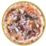
Pescatora ペスカトーラ ¥ 2,700-

トマトソース、プロヴォラチーズ(燻製モッツアレラ)、バジル、EXVオリーブオイル Tomato sauce, smoked mozzarella cheese, basil, extra virgin olive oil