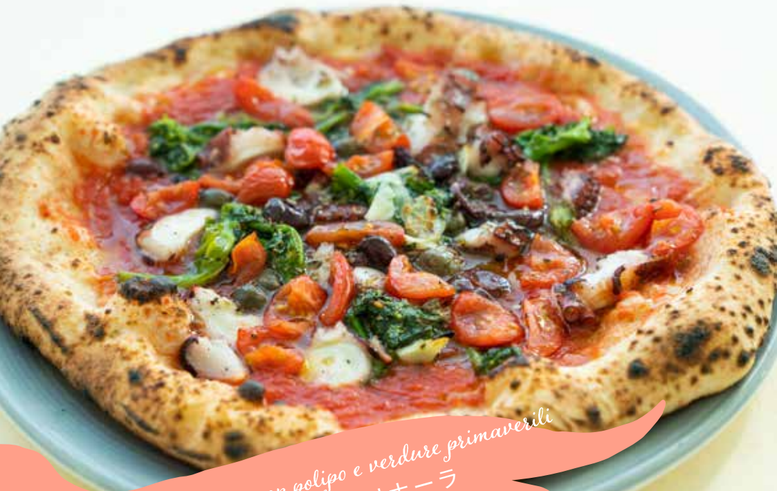
Pizza alla marinara con polipo e verdure primaverili 春野菜と真蛸のマリナーラ