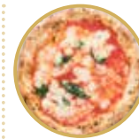
Margherita Classica マルゲリータ クラッシカ ¥ 1,800-

トマトソース、にんにく、オレガノ、バジル、EXVオリーブオイル Tomato sauce, garlic, oregano, basil, extra virgin olive oil