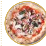
Capricciosa カプリチオーザ ¥ 2,600-

トマトソース、モッツアレラチーズ、辛口サラミ、バジル Tomato sauce, mozzarella cheese, spicy salami, basil