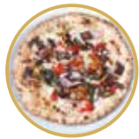
Ortolana オルトラーナ(八百屋風) ¥ 2,300-

モッツアレラチーズ、チコリ(豚バラ肉のコンフィ)、リコッタチーズ、黒胡椒、バジル Mozzarella cheese, fried pork, ricotta cheese, black pepper, basil