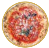
Cosacca Napule コサッカ ナブレ ¥ 1,700-

トマトソース、ミニトマト、ペコリーノチーズ、にんにく、オレガノ、バジル Tomato sauce, cherry tomatoes, pecorino cheese, garlic, oregano, basil