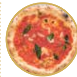
Marinara Classica マリナーラ クラッシカ ¥ 1,600-

トマトソース、ミニトマト、アンチョビ、ケッパー、にんにく、ガエータ産オリーブ、オレガノ、バジル、EXVオリーブオイル Tomato sauce, cherry tomatoes, anchovies, capers, garlic, Gaeta olives, oregano, basil, extra virgin olive oil