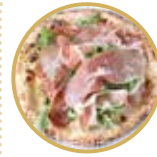
Prosciutto e rucola 生ハムとルーコラ ¥ 2,600-

プロヴォラチーズ(燻製モッツアレラ)、自家製ソーセージ、マッシュルーム、ガエータ産オリーブ、バジル Smoked mozzarella cheese, homemade sausage, mushrooms, Gaeta olives, basil