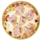
Vivadella ヴィヴァデッラ ¥ 2,600-

トマトソース、本日の魚介類、ケッパー、にんにく、オレガノ、バジル、EXVオリーブオイル Tomato sauce, seafood of the day, capers, garlic, oregano, basil