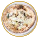
Cicoli チコリ ¥ 2,500-

トマトソース、モッツアレラチーズ、ロースハム、マッシュルーム、ガエータ産オリーブ、アーティチョーク、バジル Tomato sauce, mozzarella cheese, ham, mushrooms, Gaeta olives, artichoke, basil