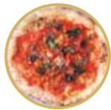
Tarantina タランティーナ ¥ 1,700-

トマトソース、ミニトマト、ペコリーノチーズ、にんにく、オレガノ、バジル Tomato sauce, cherry tomatoes, pecorino cheese, garlic, oregano, basil