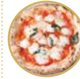
Margherita con provola プロヴォラチーズのマルゲリータ ¥ 2,300-

トマトソース、水牛のモッツアレラチーズ、バジル、EXVオリーブオイル Tomato sauce, buffalo mozzarella cheese, basil, extra virgin olive oil