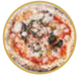
Romana ロマーナ ¥ 2,000-

トマトソース、モッツアレラチーズ、バジル、EXVオリーブオイル Tomato sauce, mozzarella cheese, basil, extra virgin olive oil