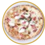
Macellara マチェッラーラ ¥ 2,700-

プロヴォラチーズ(燻製モッツアレラ)、自家製ソーセージ、季節の野菜、バジル Smoked mozzarella cheese, homemade sausage, seasonal fresh vegetables, basil