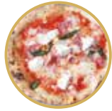
Lasagnetta ラザニエッタ ¥ 2,400-

トマトソース、モッツアレラチーズ、アンチョビ、ケッパー、オレガノ、バジル Tomato sauce, mozzarella cheese, anchovies, capers, oregano, basil