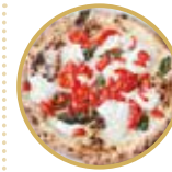
Margherita d'oro マルゲリータ エクストラ ¥ 2,800-

モッツアレラチーズ、ミニトマト、バジル、EXVオリーブオイル Mozzarella cheese, cherry tomatoes, basil, extra virgin olive oil