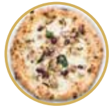
Buongustaio ブォングスタイオ ¥ 2,600-

プロヴォラチーズ(燻製モッツアレラ)、ミニトマト、サラミ、ルーコラ、バジル、EXVオリーブオイル Smoked mozzarella cheese, cherry tomatoes, salami, rocket salad, basil, extra virgin olive oil