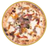
Salsiccia e Verdure サルシッチャ エ ヴェルドゥーレ ¥ 2,500-

モッツアレラチーズ、ゴルゴンゾーラチーズ、タレグジョチーズ、ペコリーノチーズ Mozzarella cheese, gorgonzola cheese, taleggio cheese, pecorino cheese