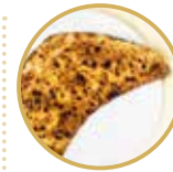
Ripieno Bianco リピエノ ビアノコ ※具を包み込んだピッツァです! ¥ 2,700-

トマトソース、モッツアレラチーズ、リコッタチーズ、サラミ、チコリ(豚バラ肉のコンフィ)、黒胡椒、バジル、EXVオリーブオイル Tomato sauce, mozzarella cheese, ricotta cheese, salami, fried pork, black pepper, basil, extra virgin olive oil