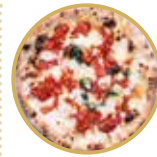
Margherita bianca con pomodoro al filetto フレッシュトマトのマルゲリータ ¥ 2,100-

モッツアレラチーズ、季節の野菜、ペコリーノチーズ、バジル、EXVオリーブオイル Mozzarella cheese, seasonal fresh vegetables, pecorino cheese, basil, extra virgin olive oil